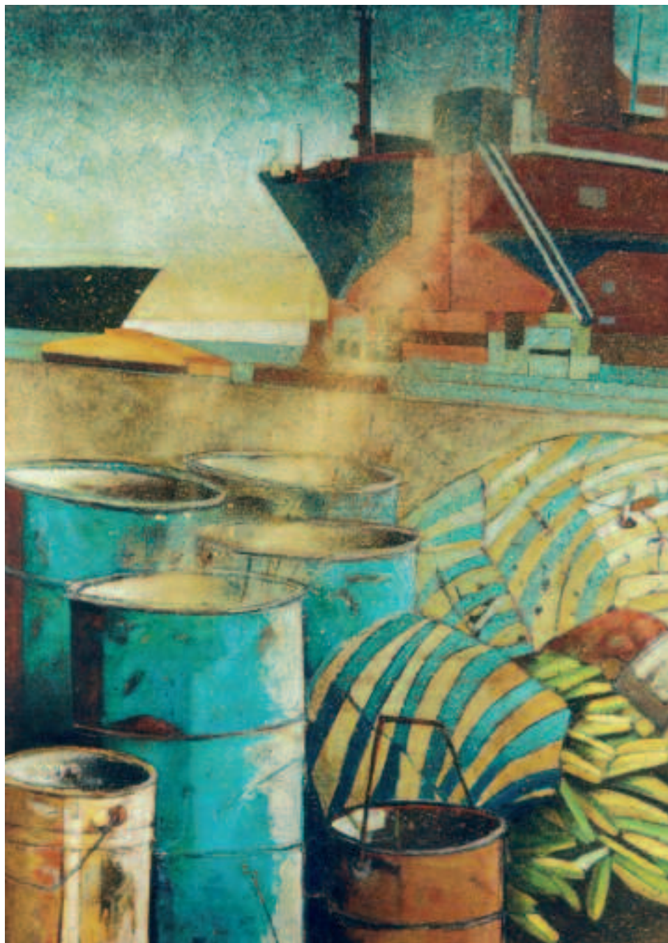
Véronique de Guitarre : Sur les Quais • Acrylique sur bache • 150 x 120 cm