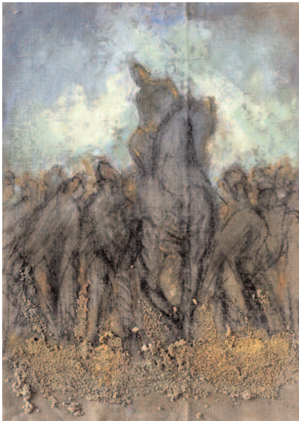
Elisabeth Walcker : Chevauchée n°3 • Acrylique sur toile • 130 x 97 cm