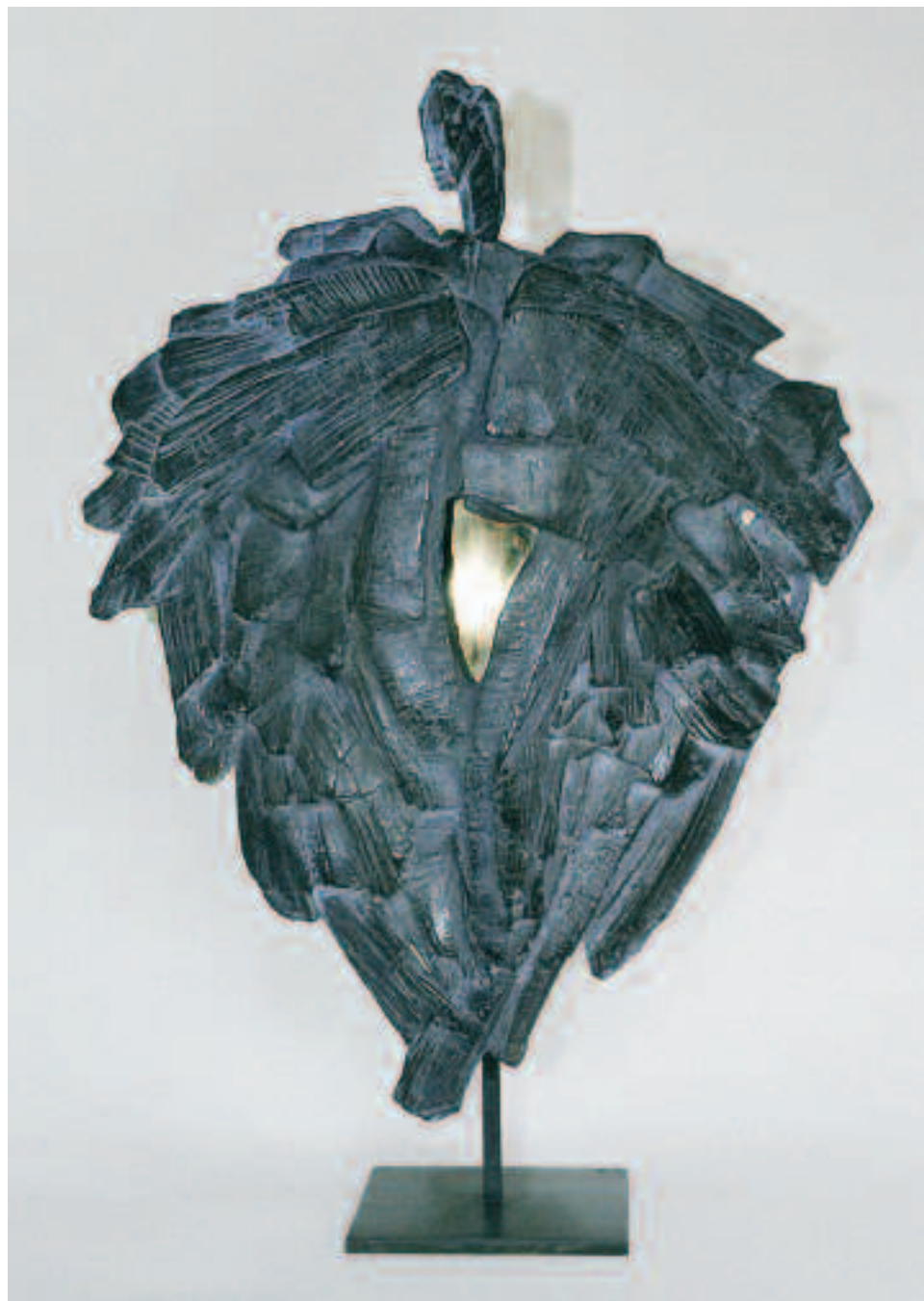
Sophie Cavalié : Carapace de l'ange