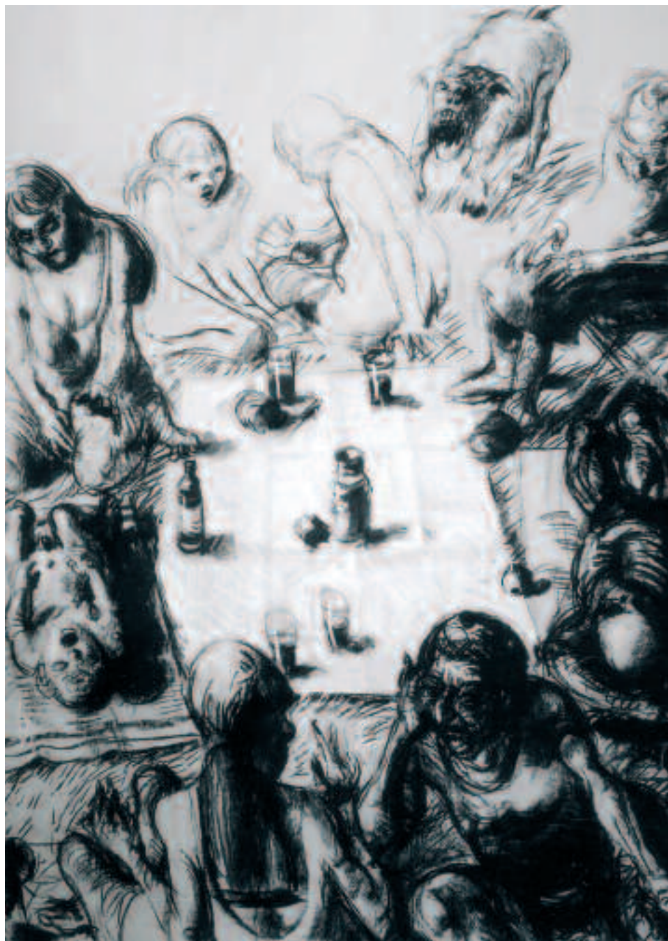
Jörg Hermlé : Déjeuner sur l'herbe • 146 x 114 cm