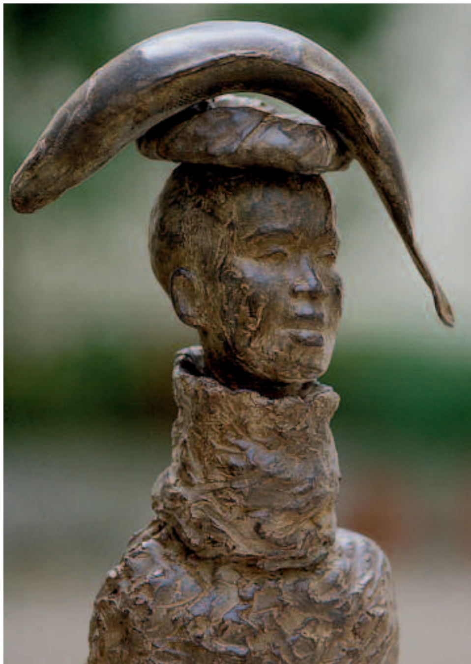
Marine de Soos : Femme au Poisson • Bronze • 38 x 26,5 x 16 cm