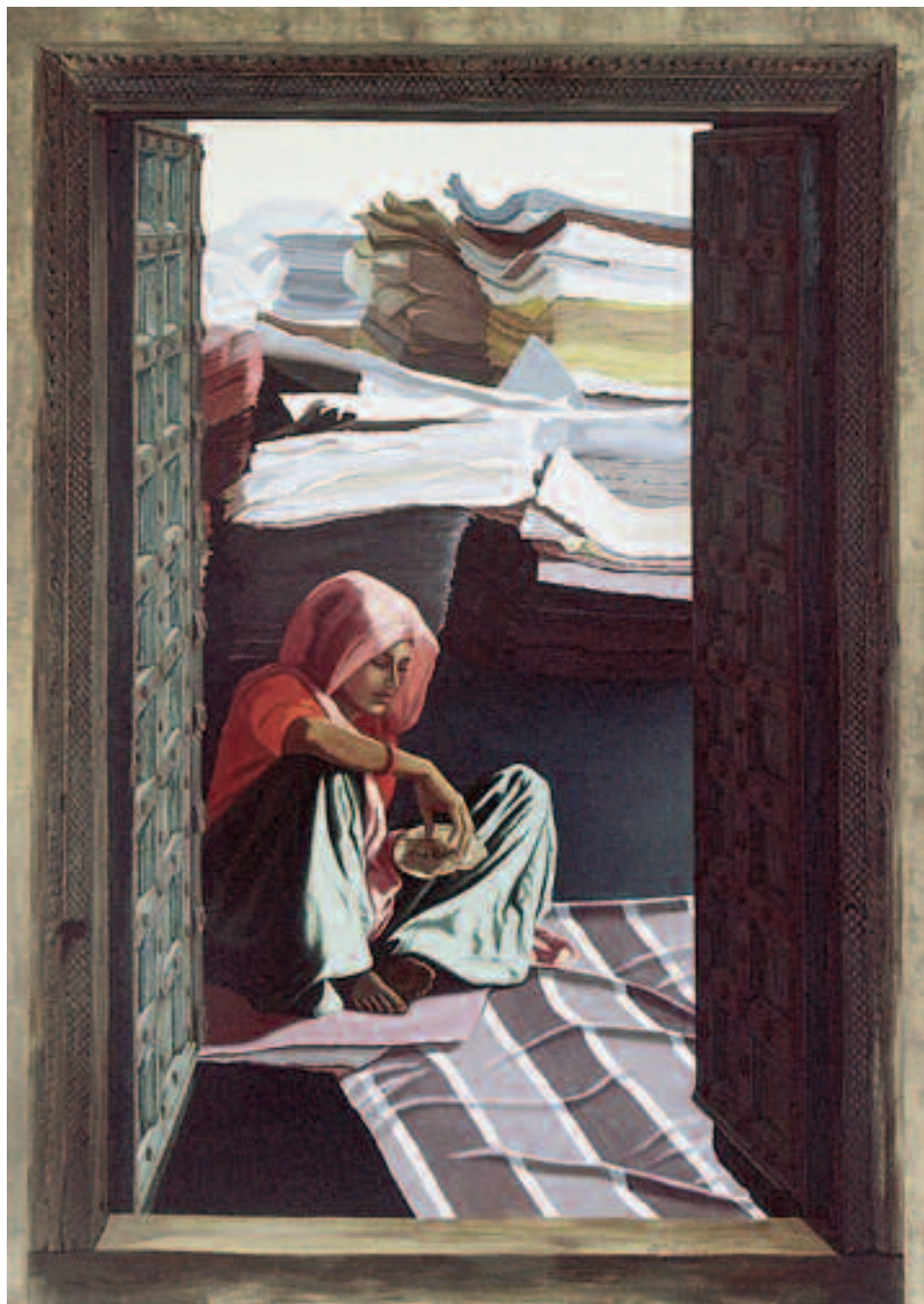
Nadine Le Prince : Pause dans la fabrique de papier • 195 x 130 cm